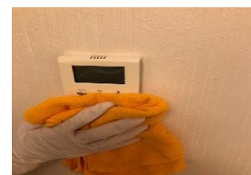
エアコンのスイッチ部分