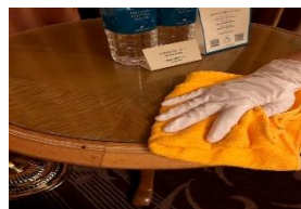
テーブルなど家具類