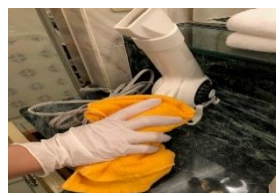
ドライヤーなどの備品