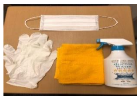
除菌で使用する道具