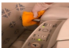
トイレの洗浄レバーやボタン部分