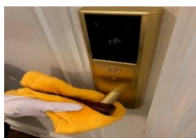
室内外のドアノブ