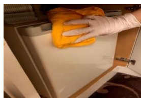
冷蔵庫や金庫など