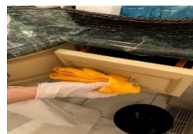
引き出し類の取っ手