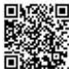
マスクを使っでの装着動画